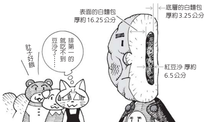
【圖3】送給人吃的麵包臉，裡面應該是這樣的

為了正義付出的辛苦還不只如此。看了《紅豆麵包超人》的網頁才發現，原來紅豆麵包超人自己就發表過以下的證詞：「我雖然不吃東西，也不會肚子餓；但相對的，我的臉每天都要換一個新鮮的才行。」